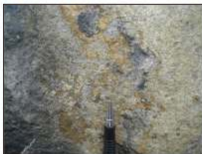
Endapan larutan silika menempel pada permukaan lava plat