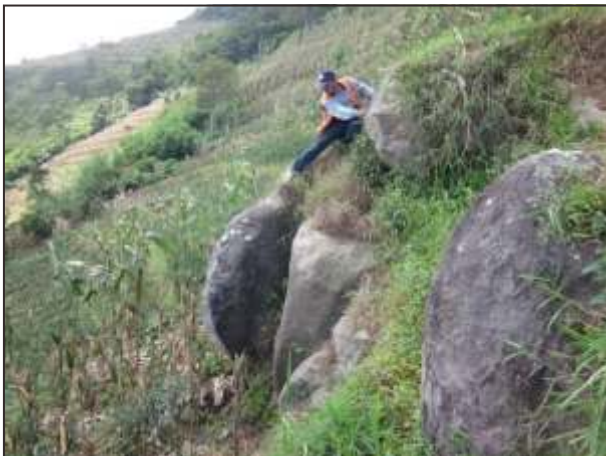
Gambar 10. Singkapan lava pada lereng utara G. Sadahurip.