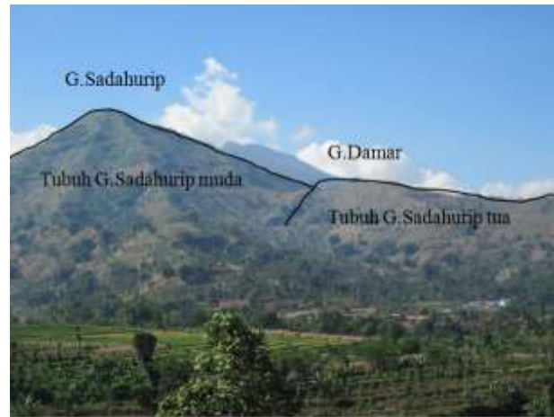
Gambar 4. Pembentukan G. Sadahurip.

G. Talagabodas membuka ke timur laut yang di dalamnya tumbuh terdapat G. Sadahurip dan G. Talagasaat). G. Sadahurip berbentuk kerucut, alur-alur air halus dan membentuk pola radial, serta di puncaknya tidak dijumpai kawah.