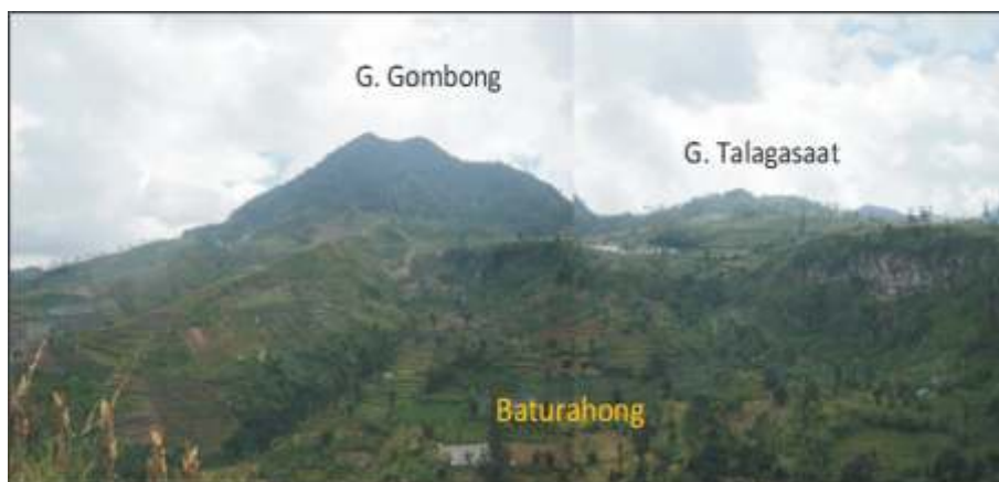
Gambar 5. Baturahong dilihat dari G. Sadahurip.

lereng bervariasi dari 10^\circ sampai 45^\circ , berlembah sempit dan dalam, berpola aliran sub-radial, disusun oleh lava, dengan vegetasi penutup berupa hutan lebat. Morfologi G. Gombong ditabrak oleh morfologi G. Sadahurip dan di bagian barat ditabrak oleh Morfologi G. Talagasaat. Berdasarkan kenampakan tersebut diinterpretasikan bahwa G. Gombong muncul lebih awal dibandingkan dengan G. Talagasaat dan G. Sadahurip.