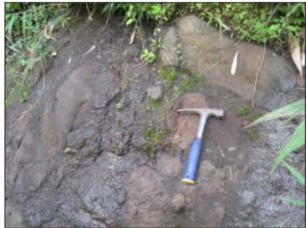
Gambar 9. Singkapan breksi lava di lereng utara G. Damar.