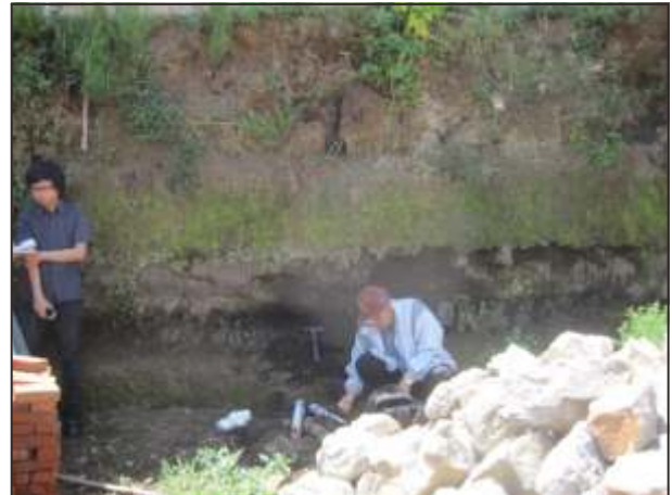
Gambar 15. Singkapan endapan jatuhnya piroklastika di Kp. Cicarparisir.

Batuan penyusun tubuh G. Sadahurip tersusun oleh lava andesit dan sebagian besar tubuh tersebut ditutupi oleh endapan jatuhnya piroklastika.