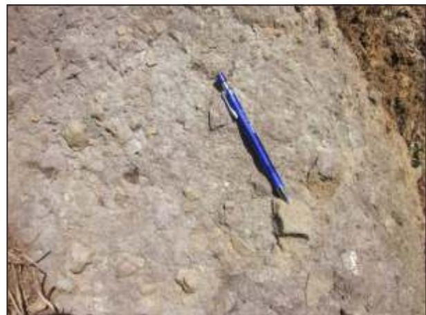
Gambar 11. Singkapan breksi lava di lereng timur G. Sadahurip.