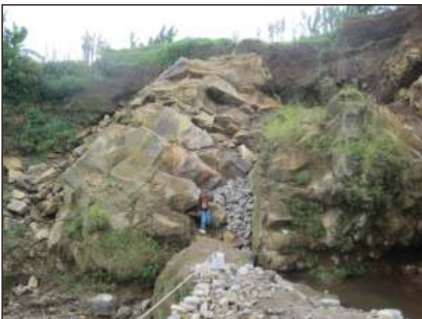
Gambar 8. Singkapan lava berstruktur plat di Cicapar Lebak.