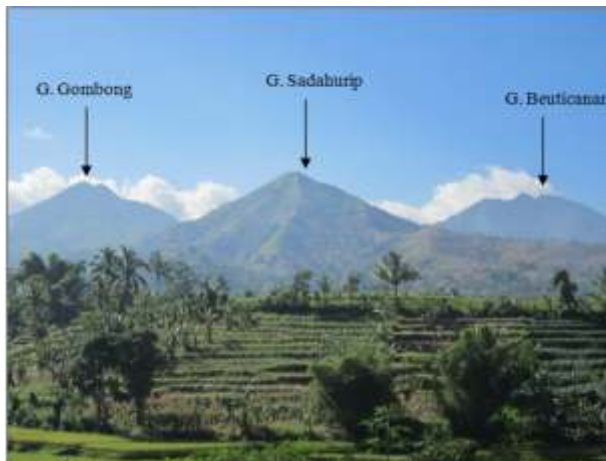
Gambar 1. G. Sadahurip dilihat dari Karangtengah dengan latar belakang G. Gombong (kiri), dan G. Beuticanar (kanan).

Berdasarkan Peta Geologi Lembar Garut skala 1:100.000 (Alzwar drr.,1992), dan hasil pemetaan geologi gunungapi (Mulyana drr.,2000) daerah ini didominasi oleh batuan hasil kegiatan gunung api Kuarter, yang pada umumnya masih memperlihatkan kenampakan kerucut (Gambar 1); sementara itu bangunan piramida tidak dikenal di budaya Indonesia (Yondri,2011, komunikasi pribadi). Oleh karena itu, secara geologi dugaan G. Sadahurip merupakan bangunan piramida menjadi janggal.