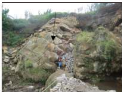
Larutan silika mengendap di celah lava plat

Bongkah batuan dengan bercak putih terdapat di Kampung Cicaparlebak, terletak kurang-lebih 60 m dengan posisi relatif lebih rendah dari singkapan lava yang berstruktur kekar lembar atau kekar plat di daerah tersebut. Penampakan ini diisukan sebagai batu bertulis, yang dianggap sebagai prasasti kuno. Berdasarkan pengamatan gemology, bercak-bercak putih tersebut ternyata adalah kuarsa susu ( milky quartz ) yang lazim ditemukan di dalam rekahan lava hasil pengisian larutan hidrotermal. Pola bercak-bercak putih tersebut yang menyerupai huruf kuno ditafsirkan sebagai hasil pelapukan dan erosi dengan tingkatannya berbeda, karena terdapat beberapa kuarsa susu yang kekerasannya bervariasi, yaitu adanya kuarsa susu lunak, dan kuarsa susu yang masih utuh dengan kekerasan lebih dari 6 skala Mohs. Adanya bongkah lava dengan kuarsa susu ini berkaitan dengan proses mineralisasi hidrotermal yang sejauh ini tidak ditemukan pada singkapan-singkapan lainnya. Bentuk bongkahannya yang membulat (Gambar16) menunjukkan batuan tersebut hasil transportasi dan permukaannya telah tererosi. Sebagai tambahan, tulisan prasasti kuno pada umumnya digores di permukaan batu dan bukan menempel.