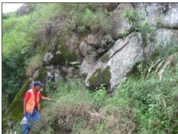
Gambar 12. Singkapan lava masif di lereng barat G. Sadahurip.

Singkapan di puncak G. Sadahurip berupa bongkah-bongkah lava andesit berukuran 30 cm - 64 cm, bentuk tidak teratur dan permukaan relatif membulat. Batuan tersebut berwarna abu-abu, masif, tekstur porfiritik, ukuran fenokris 0,5 - 2,5 mm, struktur masif dan vesikuler, fenokris berupa plagioklas (0,5 - 1,5 mm, 30 %), piroksen (1 - 2 mm, 10 %), hornblenda (1-2,5 mm, 1%), massa dasar mineral mafik yang afanitik. Menurut klasifikasi Travis (1955), batuan ini termasuk andesit.