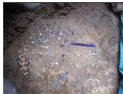
Batuan runtuh dan tertransport, permukaan tererosi, menjadi bercak-bercak putih