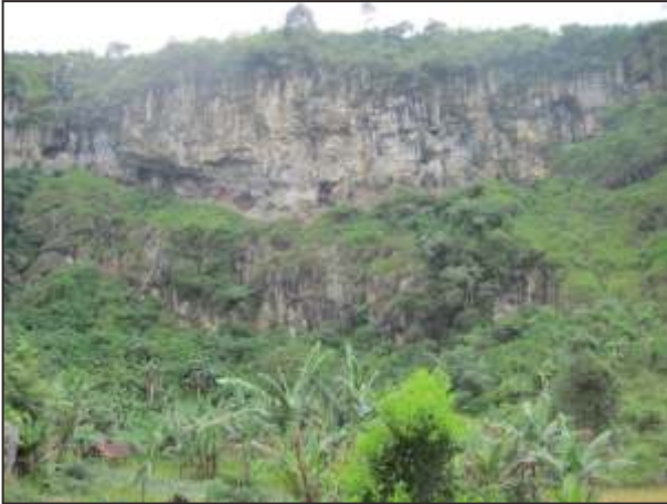
Gambar 14. Singkapan aliran lava Talagasaat di dinding timur Baturahong

sedangkan di bagian atas merupakan perselingan antara lapisan berbutir kasar dan halus dengan ketebalan lapisan bervariasi dari 10 cm sampai 70 cm, umumnya lebih urai, dan didominasi oleh litik andesit basaltik berukuran abu. Hasil pentarihan umur endapan piroklastika (Paleosoil) yang diambil di Kp. Cicarparisir, menunjukkan umur 14000 220 B.P. (1950) dan Paleosoil di bawah tempat parkir 13320 300 B.P. (1950).