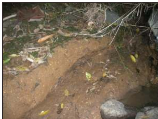
Gambar 13. Singkapan endapan aliran piroklastika di Ci Dalem

G. Talagabodas tumbuh di dalam kawah G. Talagabodas Tua dan ditunjukkan oleh tubuh gunung