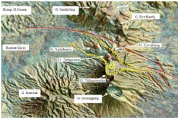
Gambar 3. Data indera jauh dan hasil interpretasi geologi G. Talagabodas dan sekitarnya.