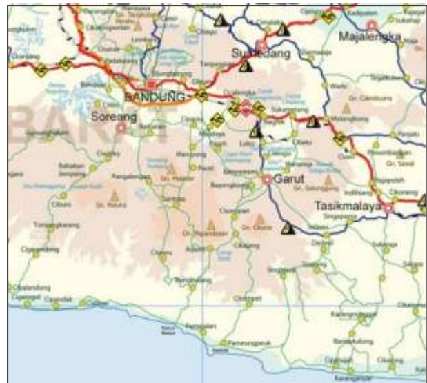
Gambar 2. Lokasi G. Sadahurip.

Untuk mengetahui kondisi geologi G. Sadahurip, pada awalnya melakukan kajian geologi regional, dilanjutkan interpretasi geologi data indera jauh, dan diikuti penelitian lapangan dan analisa laboratorium. Hasilnya dituangkan dalam peta geomorfologi dan peta geologi. Berdasarkan kedua peta tersebut dilakukan analisis pembentukannya, dan berdasarkan bentuk gunungapi, batuan penyusunnya dan proses geologi (erosi dan pelapukan) dihubungkan dengan keberadaan piramida.